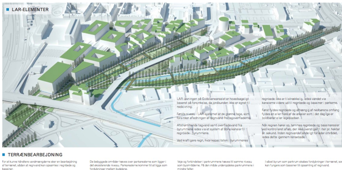
FIGUR 6 GODSBANEAREALE LAR ELEMENTER

Godsbaneearealet er bygget på det tidligere DSB fragtværft og lagerdistrikt, og vil blive omdannet til et beboelses- og arbejdsområde, herunder studenterboliger. Derudover er imødegåelse af klimaændringer og tilpasningsforanstaltninger indarbejdet i den nye udvikling, såsom LAR og afdække eksisterende floder. Området ligger 100 meter fra både tog- og busstationer, og er beliggende tæt på gågaden.