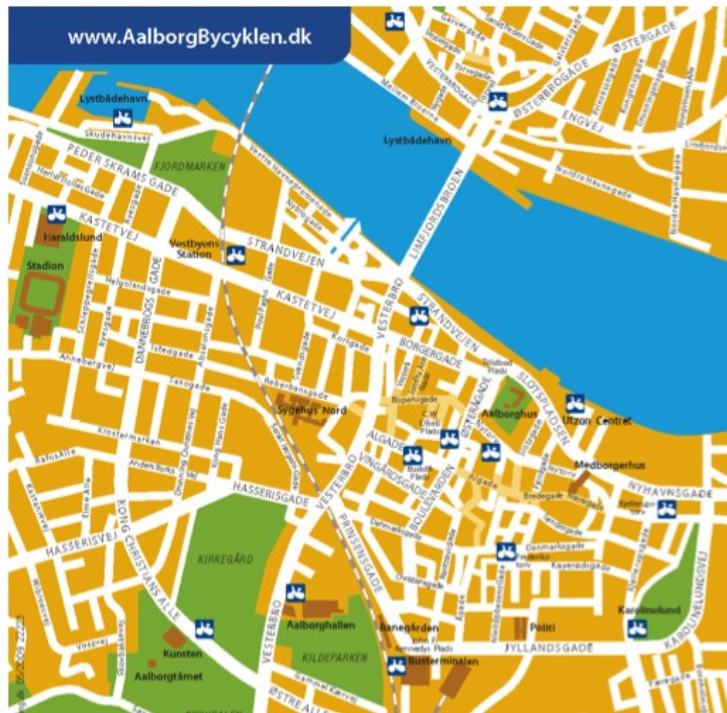
FIGUR 4 KORT OVER BYCYKEL-STATIONER I AALBORG (AALBORGBYCYKLEN.DK).