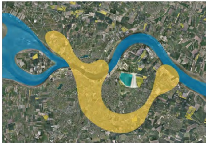
FIGUR 1 VÆKSTAKSEN I AALBORG (AALBORG KOMMUNE 2012)

I Aalborg er der ligeledes fokus på infrastruktur og der er flere forskellige projekter i gang for at skabe bedre forhold både i den kollektive trafik og for cyklister. Der er oprettet en miljøzone hvor det kun er tilladt for lastbiler der lever op til euronorm 4 at køre ind. Der er beskrevet en vækstakse som viser, hvor der forventes at ske størst vækst i fremtiden, og hermed også formentlig vil komme stigende trafik. Derfor har der været store overvejelser omkring etablering af en tredje forbindelse over Limfjorden, og det er blevet vedtaget at det skal være en forbindelse vest om byen, men grundet nedskæringer i nye projekter for infrastruktur er det udskudt.