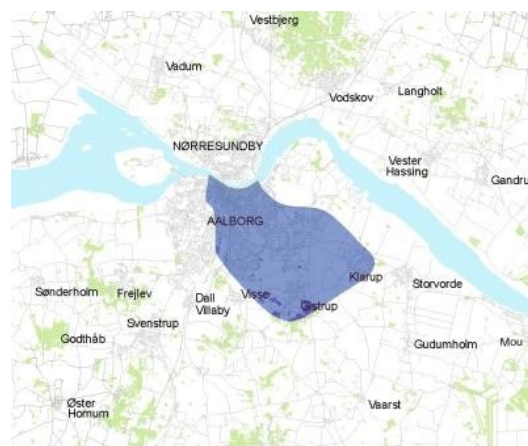
FIGUR 3 ARCHIMEDES OMRÅDE I AALBORG (AALBORG KOMMUNE 2011C)

Aalborg Kommune har en befolkning på ca. 194 000 og byområdet en befolkning på ca. 121 500. Archimedes-korridoren går fra centrum til de østlige byområder i kommunen og danner et ideelt område med henblik på at vise, hvordan man kan håndtere trafik og mobilitet fra de indre byområder til yderkanten af byen.