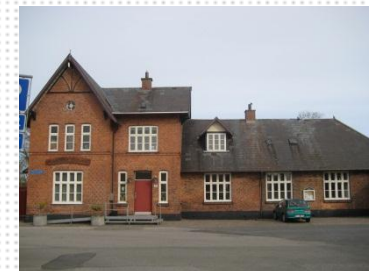
Kulturhuset i Trustrup