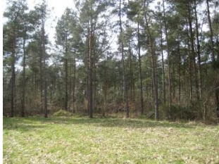
Skoven i Lyngby