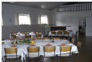
Forsamlingshuset i Lyngby