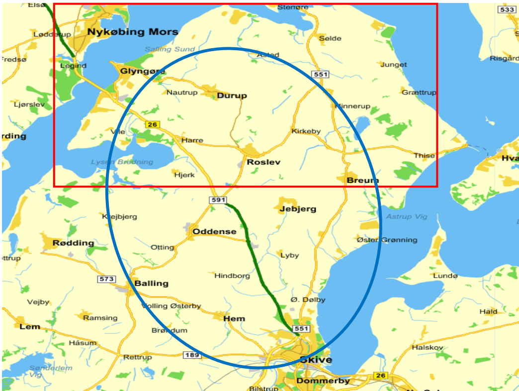
Selvforståelse før 2007