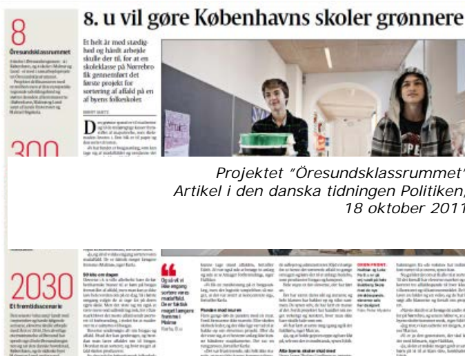
Projektet "Öresundsklassrummet" Artikel i den danske tidningen Politiken, 18 oktober 2011

Programmet synliggörs i stor grad genom godkända projekt. Nästan alla godkända projekt har en mediestrategi. Projekten har generellt sett god genomslagskraft i större regionala och lokala tidningar, till exempel Politiken, Aftenposten, Børsen, Berlingske, Jyllandsposten, GT, Göteborgsposten, Hallands Nyheter, Hallandsposten, Aarhus samt stiftstidende, Sydsvenskan samt i tidskrifter som till exempel Teknics Ukeblad och byggnyheter.se.